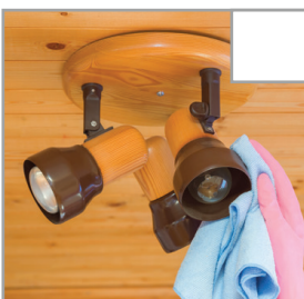
Torka lampor med en torr trasa