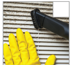
Spindelväv är borttagen. Se till att komma åt alla hörn