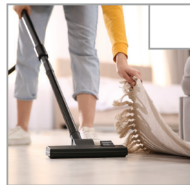
Dammsug golvet inklusive mattor (även under lösa mattor)