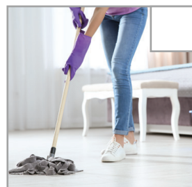
Alla tvättbara golv är våttorkade