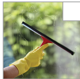
Fönstren är rengjorda från fettfläckar