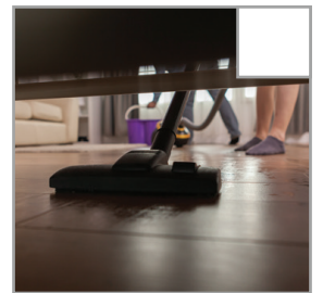
Dammsug och våttorka golvet. Glöm inte under sängen