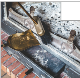
Se till att tömma eventuell aska från öppna spisen /kaminen