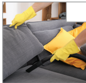
Stolar och soffor är noggrant dammsugna, även under dynorna