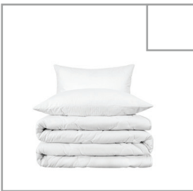
Dammsug alla sängar. Lägg kuddar och täcken snyggt på varje säng