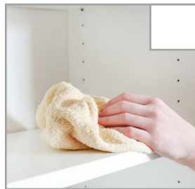
Kontrollera i skåp efter kvarglömda saker och torka av ytor på insidan och utsidan