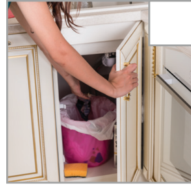
Ta bort soppåsen och torka av skåpets insida