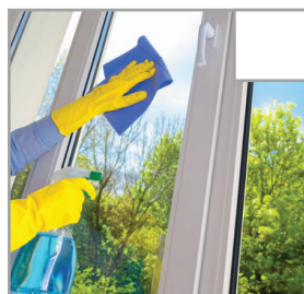
Fönster och altandörrar är rengjorda från fettfläckar